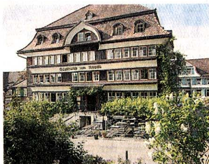
Imposantes Gasthaus: Das Rössli.