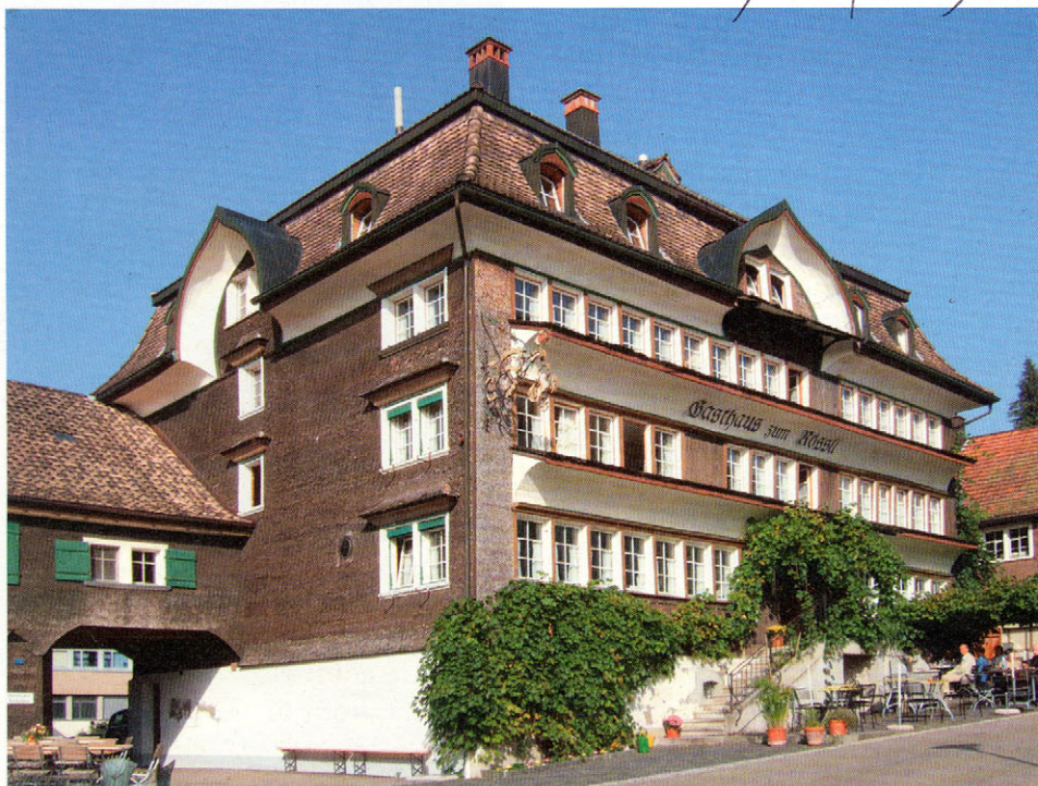
Unübersehbar: das markante »Gasthaus Rössli« im Dorfkern von Mogelsberg.

Das »Gasthaus Rössli« steht vis-à-vis der riesigen Kirche am Dorfplatz von Mogelsberg im Toggenburg. Reben umranken die Gartenwirtschaft und den Eingang des stattlichen Hauses. Eine Treppe führt ins stilvoll renovierte Innere: zu der gemütlichen Gaststube mit grossen Tischen aus Nussbaumholz auf der linken, zu den zwei hübschen Sälen auf der rechten Seite, die auch für Seminare zur Verfügung stehen. In den oberen Etagen sind die Gästezimmer untergebracht. Unter dem mächtigen Dach schliesslich befindet sich der Konzert- und Theatersaal.